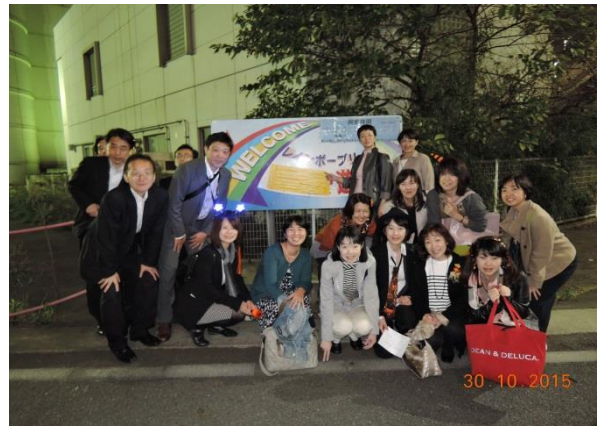
レインボーブリッジ入口

2 回目ということもあり、道はもうバッチリ!!! スタート時は早いペースで歩いて行きました♪ 昨年は歩数あてクイズ! 今年は、レインボーブリッジクイズを出題しました。(別添参照) レインボーブリッジ入口からは、クイズの答えやヒントがどこかに隠れているのでは?と注意深く 周りの掲示板など見ながらの散策でした。