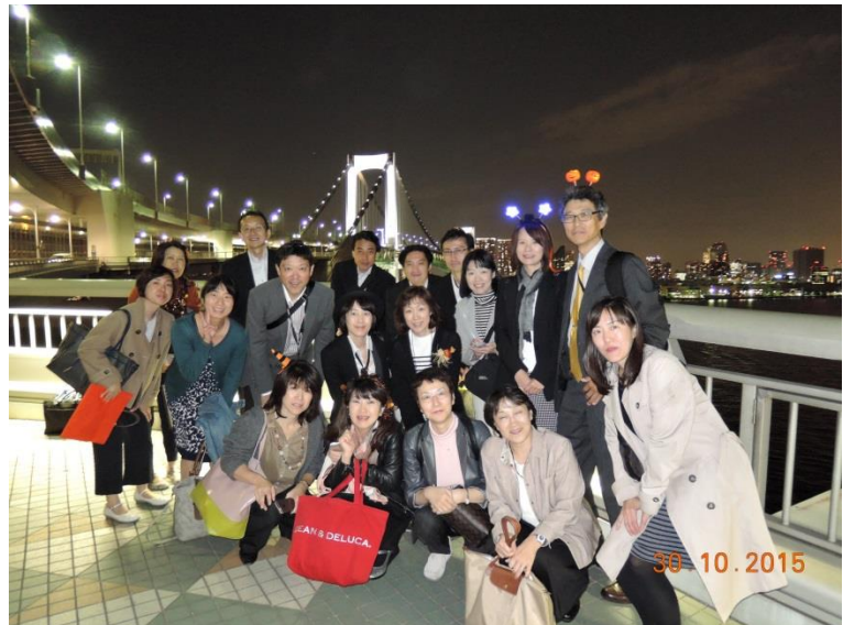
ハロウィン前日でしたので昨年より控えめな仮装です♪