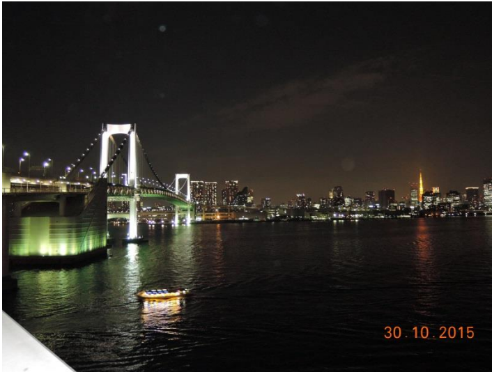
雨も降らずに今年も綺麗な景色が見られました。