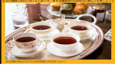
紅茶の種類と味わいは千差万別です。まずは種類別の特徴を知り飲んでみましょう 日々の暮らしや気分によって紅茶を見つけましょう