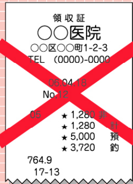
これまでの領収証 (レシートタイプ)